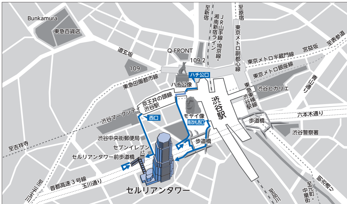
セルリアンタワー詳細図

会場／東京都渋谷区桜丘町26番1号 セルリアンタワー東急ホテル 地下2階 ボールルーム 連絡先 03-3476-3000 (ホテル代表番号)